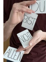
"Du bist nicht allein"

Jugendliche erkennen, dass sie mit ihren Sorgen nicht allein sind. Ihre eigenen Antworten werden durch erbauliche, erlesene und erprobte Antworten ergänzt.